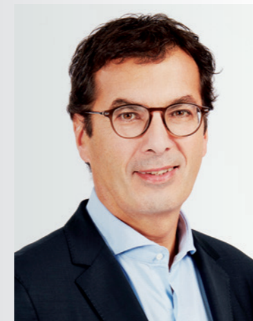
JEAN-PIERRE FARANDOU, PDG GROUPE SNCF

En tant que Sponsor Officiel de la Coupe du Monde de Rugby France 2023, le Groupe SNCF contribuera à l'événement en assurant des prestations de transport, d'ingénierie et de logistique. Notre objectif : faire de cette compétition l'événement aux plus basses émissions de CO 2 possible, alors que 2,6 millions de spectateurs sont attendus dans les stades.